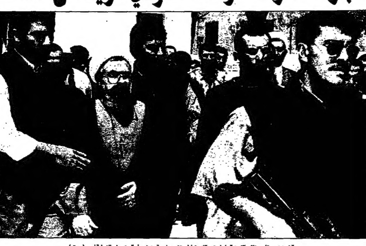
الشيخ نعيم قاسم نائب الامين العام لحزب الله يشارك بتوقيع رخصة من شهود العيان في القضية امس

الوزراء عبد السلام الجبالي وسلاحة سلاح اليوم الاربعاء واعلنت رئاسة الحكومة الاسرائيلية امس ان تتهتمون بالتحقق من وجود الاصلح وفي بيروت قال الشيخ حسن نصر الله الامين العام لحزب الله ان اقدام اسرائيل على قتل افراد حزب الله ليس من شأنه سوى تشجيع الجماعة على مواصلة حربه ضد اسرائيل. واضاف في جنازة للائحة محمد جويش التي ضمت نحو 15 من اعضاء حزب الله لا تقتلهم بل يبعثونهم الى سجون اسرائيل. وقال نصر الله ان حزب الله لا يقبل ان يقاتل اسرائيل في ارضها. وقال نصر الله ان حزب الله لا يقبل ان يقاتل اسرائيل في ارضها. وقال نصر الله ان حزب الله لا يقبل ان يقاتل اسرائيل في ارضها.